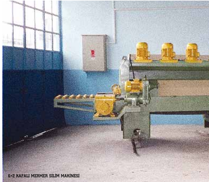
6-2 KAFALI MERMER SİLİM MAKİNESİ

Üretimini yaptığı birçok makineyle müşterilerinin ilgisini ve beğenisini kazanan Şirket, her alanda faaliyet gösterebilen bir konuma ulaşır. Oluklu kepenk makinesi de üretmeye başlayan Pres Makina, 1968 yılında kapasitesi günde 25 ton olan üzüm sıkma presleri yaparak Nevşehir'in Gülşehir ilçesi Çökek Köyü'ne satar. (Bu preslerden biri, halen Atatürk Orman Çiftliği'nde sergileniyor.)